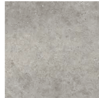
60x120 cm 24"x48" | 0006356 80x80 cm 32"x32" | 0012098 Grigio 20 mm Rett.