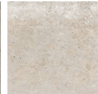
60x120 cm 24"x48" | 0006354 80x80 cm 32"x32" | 0012159 Beige 20 mm Rett.