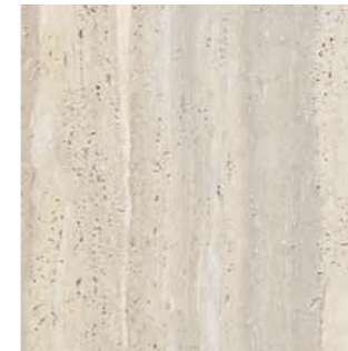
60x120 cm 24"x48" | 0010148 Crema 20 mm Rett.