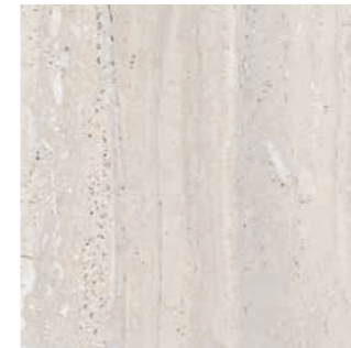
60x120 cm 24"x48" | 0010147 Avorio 20 mm Rett.