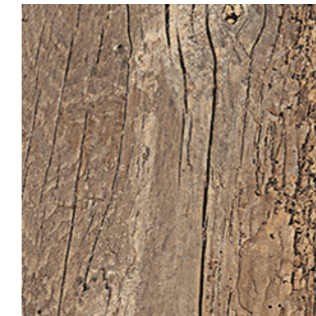
30x120 cm 12"x48" | 0003691 Havana 20 mm Rett.