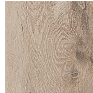
30x120 cm 12"x48" | 0003690 Sand 20 mm Rett.