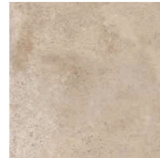
60x120 cm 24"x48" | D00202334 80x80 cm 32"x32" | D00202325 60x60 cm 24"x24" | D00202322 Ocre 20 mm Rett.