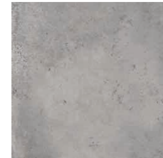
60x120 cm 24"x48" | D00202335 80x80 cm 32"x32" | D00202326 60x60 cm 24"x24" | D00202323 Gris 20 mm Rett.