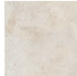
60x120 cm 24"x48" | D00202333 80x80 cm 32"x32" | D00202324 60x60 cm 24"x24" | D00202321 Ivoire 20 mm Rett.