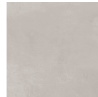
80x80 cm 32"x32" | 0012161 60x60 cm 24"x24" | 0012163 Ash 20 mm Rett.