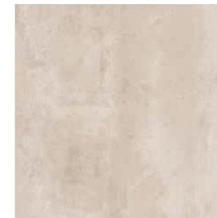
80x80 cm 32"x32" | 0012162 60x60 cm 24"x24" | 0012164 Sand 20 mm Rett.